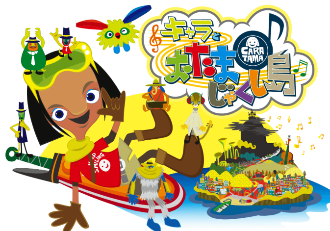
NHK テレビの門さんの作品「キャラとおたまじゃくし島」ホームページより

【著作品】「キットカット (2017,2018 ハロウィン限定版) (パッケージデザイン/ネスレ)」「ハンドトーク ジラファン(絵本/小学館)」「キャラとおたまじゃくし島(アニメ/Eテレ)」「グッドドクター(ドラマ内のキャラクター、イラストデザイン/フジテレビ)」他